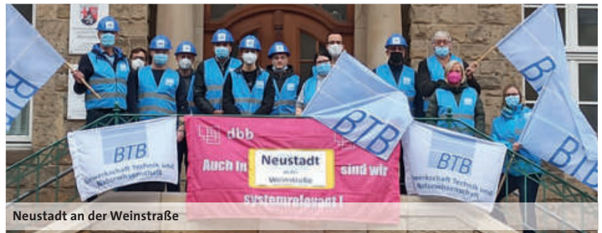
Neustadt an der Weinstraße