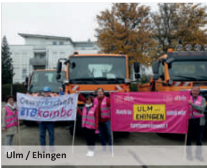
Ulm / Ehingen